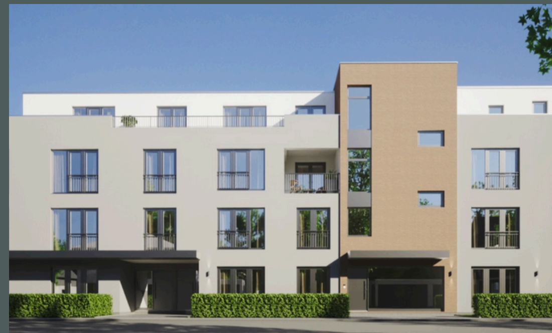
Ansicht Haupteingang von Haus B