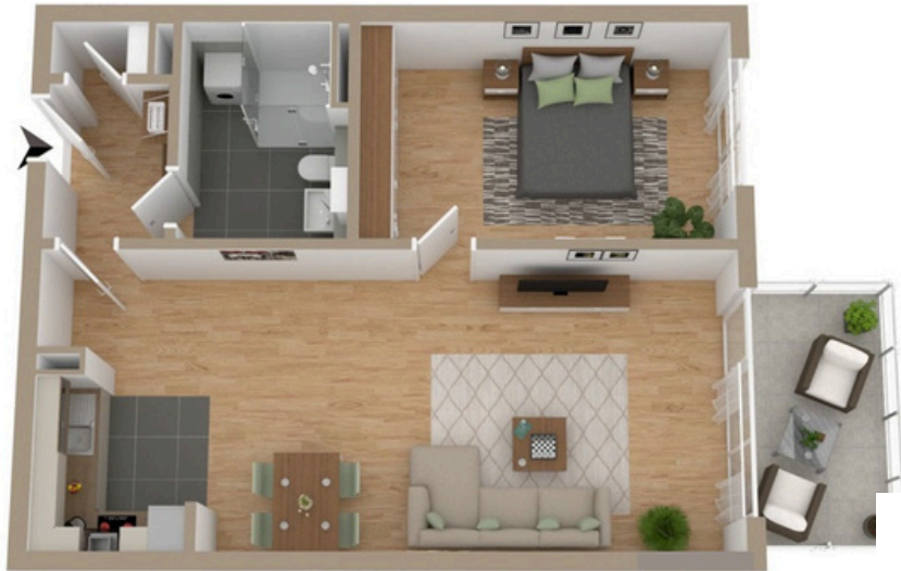
Wohnungstyp* "Quadrat" mit ca. 64 m 2