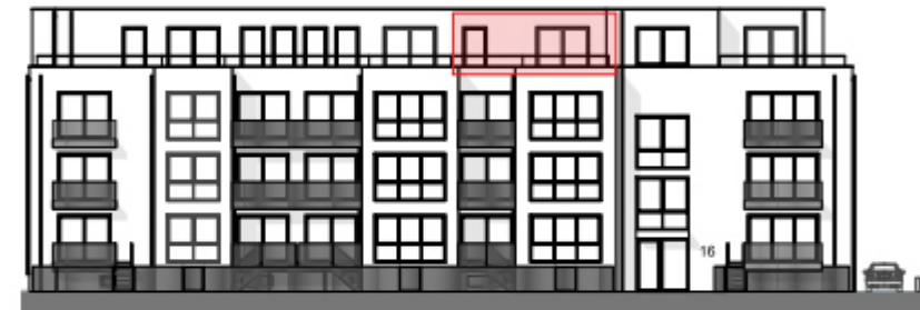
Ansicht West - Straßenseite "Am Bramhoff" -