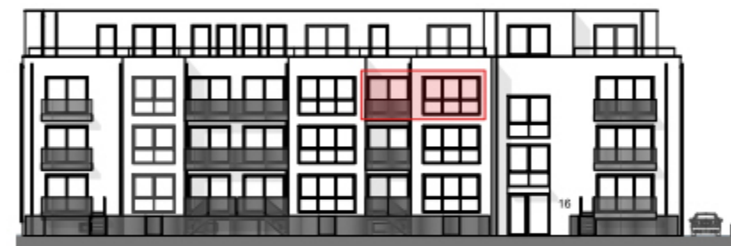
Ansicht West - Straßenseite "Am Bramhoff" -