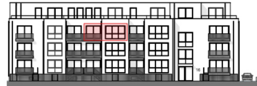
Ansicht West - Straßenseite "Am Bramhoff" -