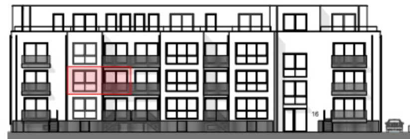
Ansicht West - Straßenseite "Am Bramhoff" -